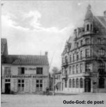
Oude-God: de post