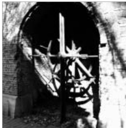
Mechanisme van de oude ophaalbrug FORT 4

We keren terug naar onze fiets. We verlaten het fort langs de hoofdingang (Krijgsbaan) en slaan rechts de Neerhoevelaan in. In de eerste bocht zien we links de Neerhoeve.