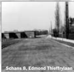
Schans 8, Edmond Thieffrylaan