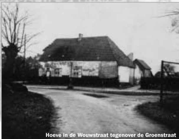
Hoeve in de Wouwstraat tegenover de Groenstraat