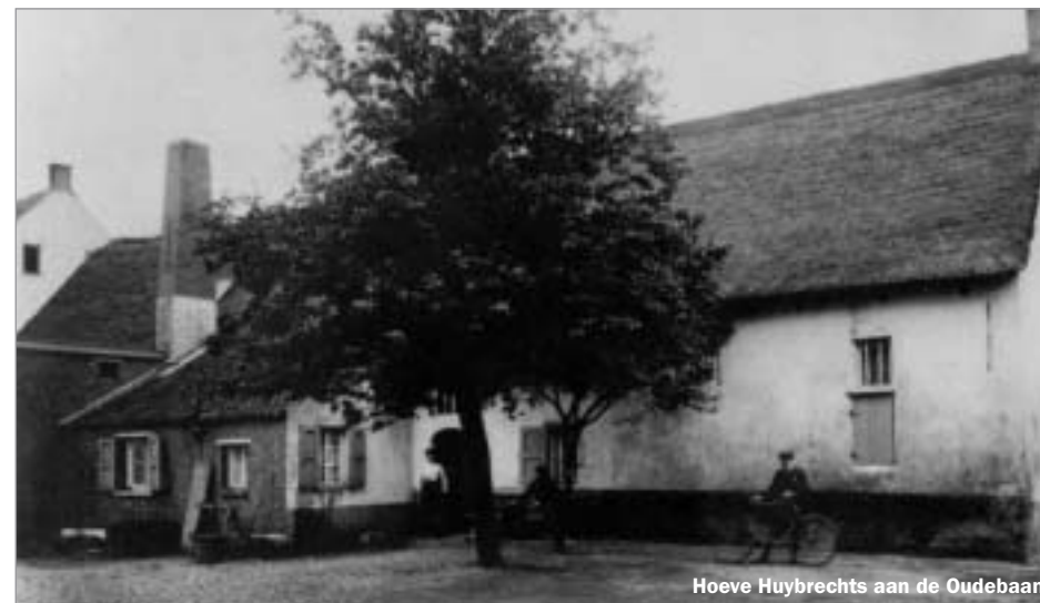
Hoeve Huybrechts aan de Oudebaan

Omstreeks 1865 werd een heel stuk Gasthuishoevengrond opgeslokt door de nieuwe fortengordel, in het bijzonder door Fort III. Tijdens de Tweede Wereldoorlog vielen vele landerijen in het door de Duitsers vergrote vliegveld en moesten de gebouwen tegen de grond. Van de vier hoeven zijn er nu nog twee overgebleven. Hoeve betekende in oorsprong een hoeveelheid grond die men 'behoefde' voor het onderhoud van aanvankelijk één gezin. In de Karolingische tijd werden de hoeven onderscheiden in 'mansi serviles' en 'mansi ingenuiles' naargelang de sociale toestand van de oorspronkelijke bewoners, slaven of vrijen. De hoeven mogen niet verward worden met de latere hoven uit het feodale tijdperk. Hoeven en hoven waren in oorsprong onbewoond. Slechts wanneer in een latere periode hierop gebouwen werden neergezet, werden beide synoniem van elkaar.