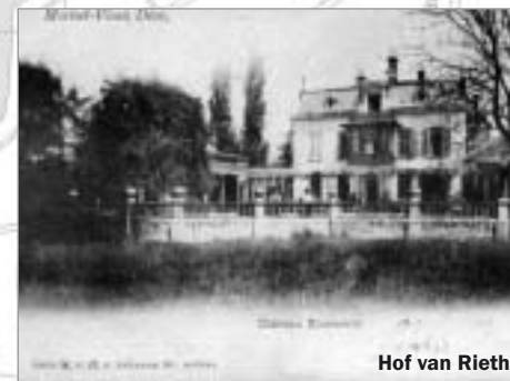
Hof van Rieth