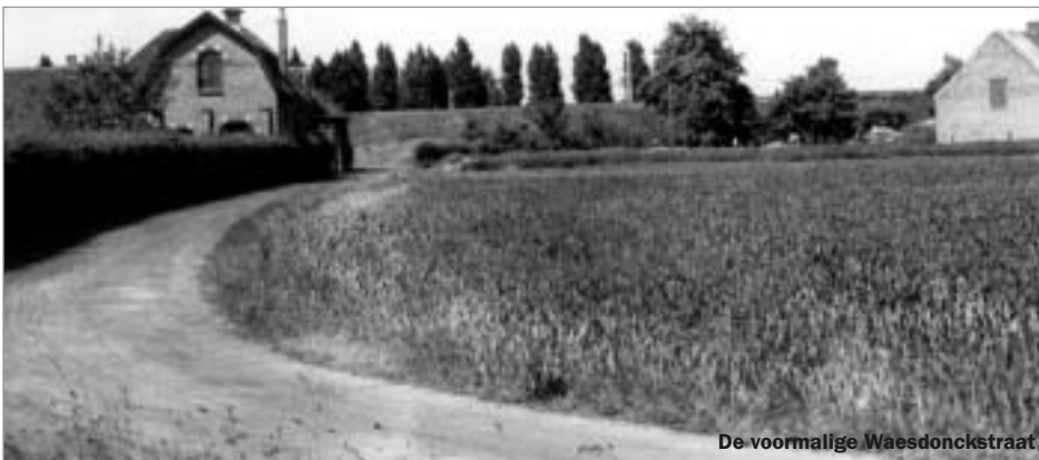
De voormalige Waesdonckstraat

Reinhildis, dochter van graaf Witger, had de villa, samen met haar andere bezittingen, aan de abdij geschonken. Een villa was samengesteld uit drie delen: de villa dominicata (woonplaats van de familie, laten en slaven), de curtes, mansa of hovas (verder afgelegen hoevegebouwen) en de villa capitanea waar de heer verbleef en recht sprak. In het ‘Hof van Dieseghem’ werd recht gesproken. Het betrof hier een laathof, waar enkel geschillen over cijnsrecht werden beslecht. De oudste documenten vermelden er reeds een schepenbank bestaande uit zeven leden en een meier. Cantecroy, tot 1295 een allodium, was mogelijk niets anders dan een uitbouw van de vroegere ‘villa capitanea’ van Dieseghem en was er tot 1573, toen het in