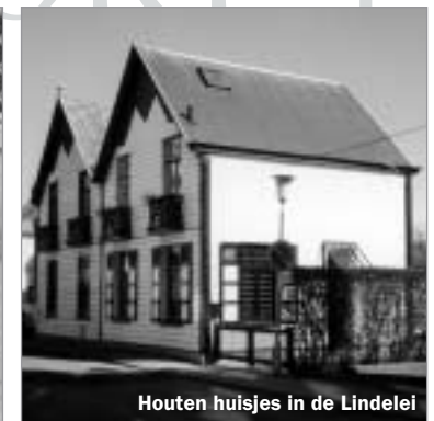
Houten huisjes in de Lindelei