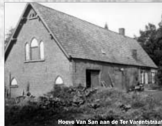
Hoeve Van San aan de Ter Varentstraat

Omstreeks 1865 werd een heel stuk Gasthuishoevengrond opgeslokt door de nieuwe fortengordel, in het bijzonder door Fort III. Tijdens de Tweede Wereldoorlog vielen vele landerijen in het door de Duitsers vergrote vliegveld en moesten de gebouwen tegen de grond. Van de vier hoeven zijn er nu nog twee overgebleven. Hoeve betekende in oorsprong een hoeveelheid grond die men 'behoefde' voor het onderhoud van aanvankelijk één gezin. In de Karolingische tijd werden de hoeven onderscheiden in 'mansi serviles' en 'mansi ingenuiles' naargelang de sociale toestand van de oorspronkelijke bewoners, slaven of vrijen. De hoeven mogen niet verward worden met de latere hoven uit het feodale tijdperk. Hoeven en hoven waren in oorsprong onbewoond. Slechts wanneer in een latere periode hierop gebouwen werden neergezet, werden beide synoniem van elkaar.