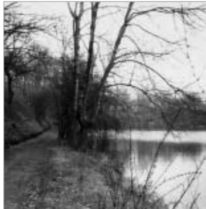
FORT 4: patrouilleweg rond het water

7 Aan de onderzijde van de poort kan je merken dat de toegangsweg ooit verlaagd werd om hogere vrachtwagens door te laten. Voorbij de wachtlokalen, aan beide zijden van de bomvrije gang, is er een trap die toegang geeft tot de omwalling. Soldaten van het landleger, die zouden kamperen in de velden achter het fort, konden via deze trappen snel de aarden omwalling bereiken om het fort te helpen verdedigen. Op het einde van de bomvrije gang geven twee deurtjes toegang tot het contrescarp. Langs hier konden ook soldaten van buiten het fort de schietgaten bemannen die het hele reduit omringen. Zowel van binnen het reduit als vanuit het contrescarp kon men vanuit schietgaten vuren op de droge gracht, om op die manier het reduit te verdedigen. De brug over de droge gracht was oorspronkelijk in hout en ophaalbaar.