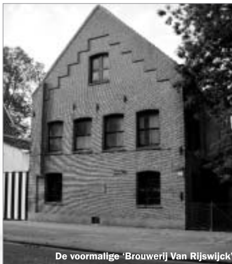
De voormalige 'Brouwerij Van Rijswijck'

Op het einde van de parking gaat deze over in een geasfalteerde weg en rijden we naast de spoorweg. Aan het verkeersbord 'Boechout' dat het begin van de bebouwde kom aanduidt, gaan we opnieuw onder de spoorweg door. Aan de andere zijde rijden we rechtdoor (richting Liersesteenweg).