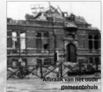
Afbraak van het oude gemeentehuis

27 Het kruispunt van de 'afgebroken brug'. In 1923 werd de spoorweg, die deel uitmaakte van het zuidelijk ring-spoor, in de hoogte gelegd en de 'brug van de Luithagen' gebouwd. Het was een metalen constructie met een vierdubbel spoor, gedragen door 16 gietijzeren palen. Hierdoor kon de tramlijn vanuit Antwerpen doorgetrokken worden tot achter het toenmalige gemeentehuis. De brug werd afgebroken in 1972.