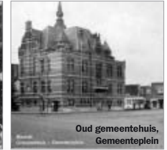
Oud gemeentehuis, Gemeenteplein