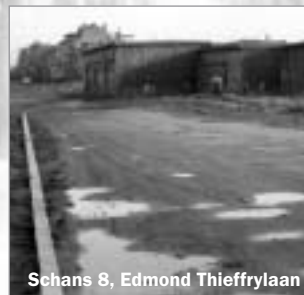
Schans 8, Edmond Thieffrylaan

25 In eerste instantie was de straat de toegangsweg tot Schans 8. Op 7 oktober 1930 werd ze dan omgedoopt tot Omheingingslei, maar de bewoners van de straat spraken van 'Lusthofkenslaan'. Op 7 september 1945 ontving de straat een nieuwe naam: 'Schanslaan'. Dat zinde de bewoners niet zodat ze twee weken later haar huidige naam kreeg. De vader van Edmond Thieffry, gemeentesecretaris van Etterbeek, was eigenaar van enkele percelen grond in de huidige Lusthovenlaan. Zoon Edmond, geboren op 28 september 1892, had aan de Omheingingslei-zuid nr. 45 een buitenverblijf 'Clos des Ailes' genoemd, dat hij in de zomermaanden betrok met vrouw en kinderen. De villa, die hij in 1913 liet bouwen, is de hoekvilla, nu nummer 37 en 39. Hij werd een bekende luchtvaartpionier. In 1925 vloog hij naar het toenmalige Belgisch-Congo, een reis van 8.124 km, die 51 dagen duurde en 75 vliegrepen telde. Het was de eerste luchtverbinding tussen België en zijn kolonie. Edmond Thieffry verongelukte in Belgisch-Congo in 1929.