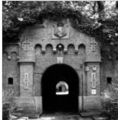
Hoofdingang FORT 4

6 Het laatste stuk van de brug was ophaalbaar. Het ophaalmechanisme is nog aanwezig in de nis links. De poortjes links en rechts geven toegang tot de patrouilleweg rond het water. Wachters moesten hier 's nachts en bij mist patrouilleren om te beletten dat de vijand het water zou oversteken. Aan de waterkant stond een meidoornhaag, de voorloper van prikkeldraad. Voorbij de grote inkompoort komen we aan het inkomgebouw. Boven de poort zien we het monogram van koning Leopold I, die de fortengordel bouwde. Het inkomgebouw is de toegang tot het reduit. Links en rechts zijn wachtlokalen; rechts voor de soldaten en links voor de officieren. Met subsidie van Toerisme Vlaanderen en Europa zullen deze lokalen worden ingericht met een permanente tentoonstelling over de Antwerpse fortengordel en FORT 4.