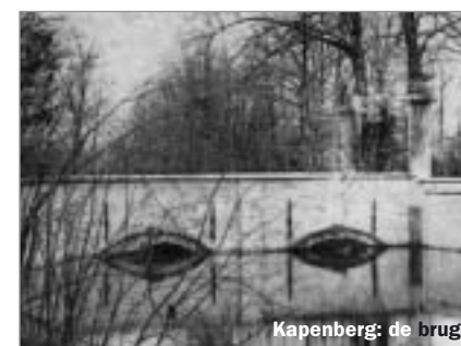
Kapenberg: de brug