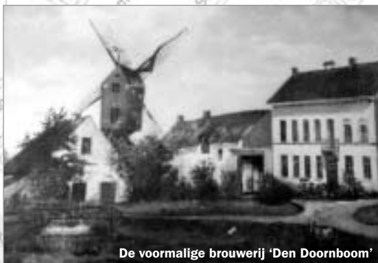
De voormalige brouwerij 'Den Doornboom'

Vorbij de spoorweg nemen we de tweede straat links: Oudebaan.