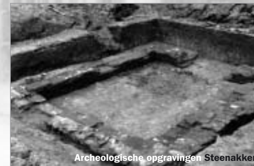
Archeologische opgravingen Steenakker

Met de opgravingscampagnes van 1962-1963 werden de resten blootgelegd van twee los van elkaar staande gebouwen, waartussen een kelder gelegen was. In opstand waren deze gebouwen opgericht in vakwerk, meer dan waarschijnlijk afgedekt met stro. De gebouwen en het erf waren omringd door een ondiepe sloot. De economische activiteit van de bewoners van deze kleine boerderij (villa) moet dezelfde geweest zijn als die van de huidige boerderijen uit de streek: gemengde bedrijven met weiden voor veeteelt en akkers voor landbouw. Aan de hand van de gevonden voorwerpen kan er met enige zekerheid gesteld worden dat deze bescheiden villa gebouwd werd tegen het einde van de 1 ste eeuw, of misschien wel het begin van de 2 de eeuw, en dat de plaats verlaten werd rond het midden van de 3 de eeuw.