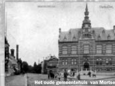
Het oude gemeentehuis van Mortsel