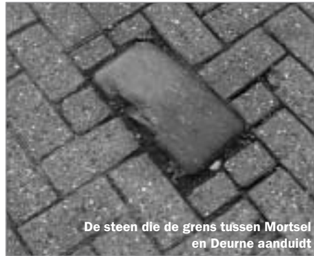
De steen die de grens tussen Mortsel en Deurne aanduidt

We rijden de tunnel onder de spoorweg in en nemen onmiddellijk links de Anna Van Hoornstraat.