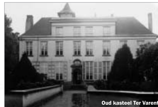
Oud kasteel Ter Varent