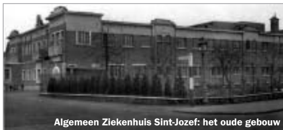
Algemeen Ziekenhuis Sint-Jozef: het oude gebouw

Voor de aan- en afvoer van grondstoffen en producten zorgde een spoorlijn die van op het fabrieksterrein over de huidige Christus Koninglaan naar het station van Mortsel Oude-God en dan verder langs het huidige John Juchempad naar de Krijgsbaan en vervolgens op de spoorwegberm naar Wilrijk en Berchem liep. De fabriek werd in de jaren 1976-1977 geleidelijk ontmanteld en afgebroken en het terrein verkaveld om er privé-woningen op te zetten.