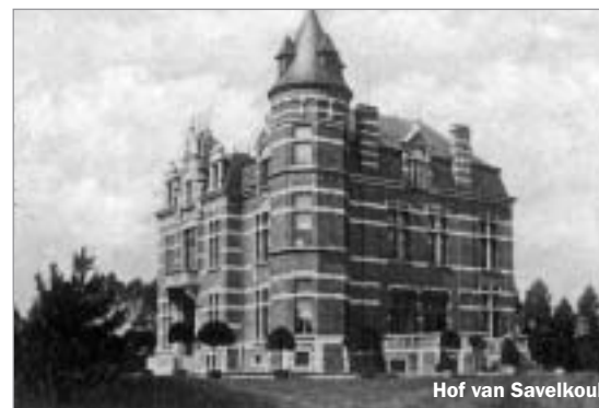
Hof van Savelkoul