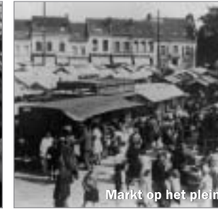
Markt op het plein