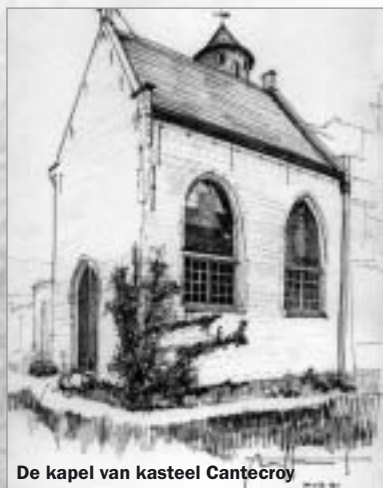
De kapel van kasteel Cantecroy